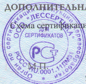
Схема сертификации – Зс по ГОСТ Р 53603-2009.